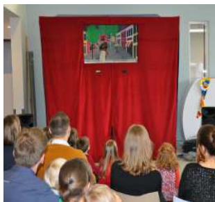
Mooie grote poppenkast