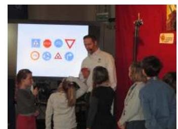
Leerinhouden op speelse manier gebracht